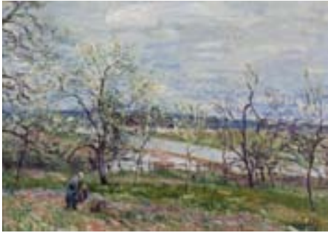
Alfred Sisley: Forår i Veneux-Nadon