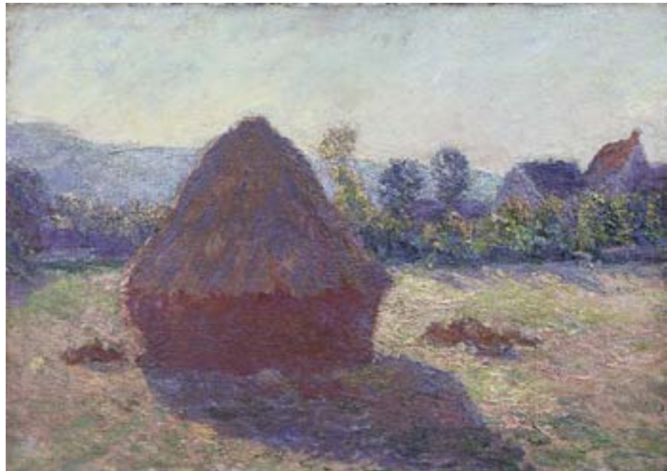
Claude Monet: Høstak i aftensol

Og selvom de impressionistiske værker med tiden er blevet stærkt kommerialiseret, så fortryller og forfører deres øjebliksskildringer af naturen og det moderne friluftsliv stadig et moderne publikum.