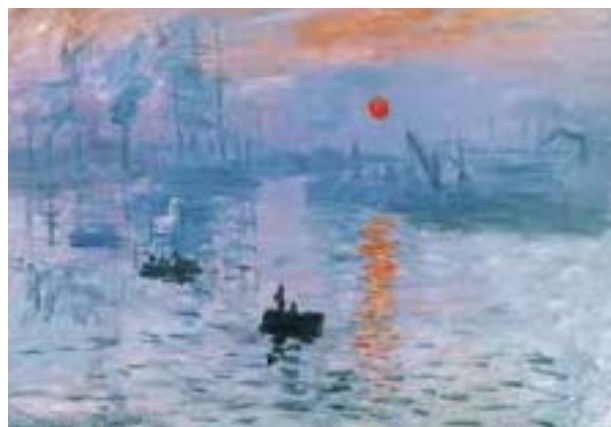
Claude Monet: Impression, Soleil levant

! Udstillingen tager dig med på en rejse. Her vil du bl.a. opleve, hvordan impressionisternes landskabsmalerier indvarslede en ny tid i kunsten, der udfordrede de akademiske traditioner om idealiserede naturskildringer.