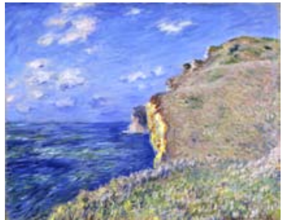
Claude Monet: Klinter ved Fécamp

Landskaberne ved de franske kyster og floder hørte til impressionisternes foretrukne motiver. Her var rig mulighed for at iagttage vandoverfladens lysreflekser og spejlinger af de mange sejlbåde og miljøerne omkring dem (som f.eks. i Monets Kystlandskab og i Alfred Sisleys Båd i Billancourt ).