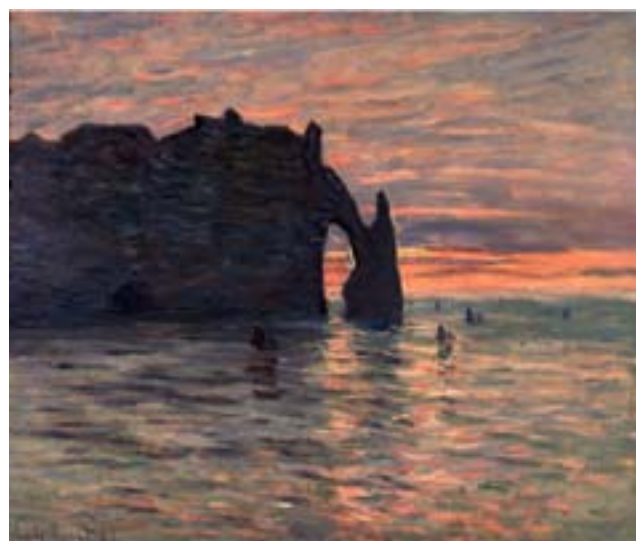
Claude Monet: Solnedgang ved Étretat

Efterhånden som Monet bliver ældre bliver hans syn også dårligere og dårligere. Derfor begynder han med alderen at male sine billeder med større pensler i bredere bevægelser, ligesom han også vælger lysere og stærkere farver.