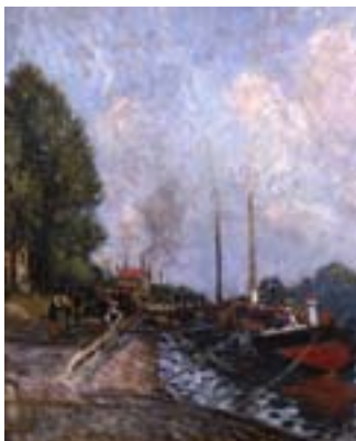
Alfred Sisley: Båd i Billancourt

Beskriv stemningen i Monets billede: En forgrening af Seinen nær Vétheuil og udpeg hvilke elementer i billedet, der bidrager til denne stemning.