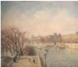
Camille Pissarro: Louvre, Morgen

Impressionisterne forsøgte at gengive hverdagens flygtige øjeblikke ved at indarbejde de påvirkninger, som lys, luft og vejr havde på de valgte motiver. Ved brugen af opbrudte penselstrøg skabte de et nyt, flimrende formsprog som kunne omsætte spontane og foranderlige indtryk til maleriske udtryk.