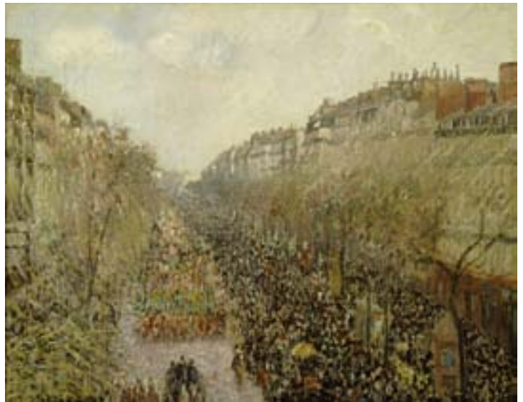
Camille Pissarro: Boulevard Montmartre, Mardi Gras

Jernbanestrukturen blev udvidet, og nyheder tikkede ind, nu hvor telegrafene og fotografiet var blevet en del af den moderne hverdag. Haussmann fik i henhold til Napoleon III's anordning anlagt nye brede boulevarder. Gaslygterne i de parisiske gader blev elektrificeret. Nye havnekajer blev bygget for at styrke trafikken på Seinen, og fodgængere og hestekærrer måtte pludselig konkurrere med automobiler og sporvogne.