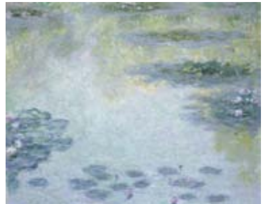
Claude Monet: Åkander

Udstillingen er en unik chance for at opleve i alt 49 værker (hvoraf de 18 er malet af Monet)