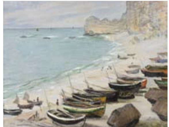
Claude Monet: Både på stranden ved Étretat

Især Monet, der var vokset op i den franske havneby Le Havre , skabte en lang række værker, hvor vandets lys, farver og refleksioner udgjorde det primære motiv.