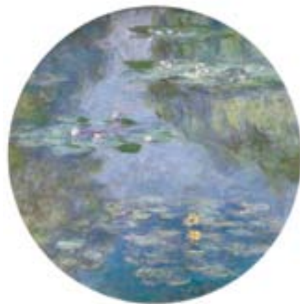
Claude Monet: Åkander

I disse åkandebilleder ses hverken mennesker, skyer, horisontlinje eller perspektiviske flugtlinjer, der leder blikket i en bestemt retning eller skaber en specifik historie. Kun et uendeligt udsnit af haven og af dammen med de flydende blomster.