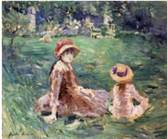
Berthe Morisot: Haven ved Maurecourt

Kig godt på billedet: Haven ved Maurecourt . Hvad er det, der rent maleteknisk (farvebrug, penselbrug, lysforhold) adskiller Morisot fra de andre impressionistiske malere?