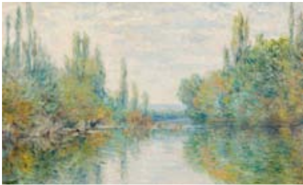
Claude Monet: En forgrening af Seinen nær Vétheuil

Monet gik endda så langt som til at få fremstillet en særlig atelierbåd, som gjorde det muligt for ham at male impressionistiske friluftsmalerier på floden. Det er ikke utænkeligt, at han fra denne atelierbåd f.eks. har malet billedet En forgrening af Seinen nær Vétheuil (1878).